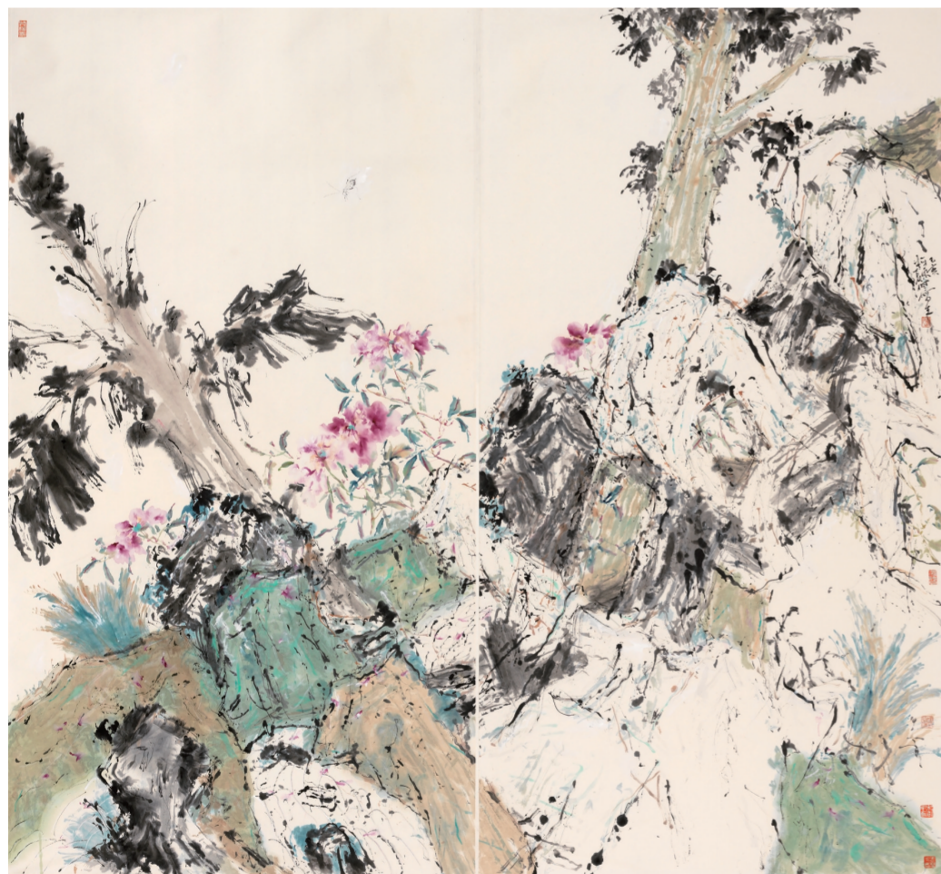
南山花开(国画) 180×97厘米×2 夏回