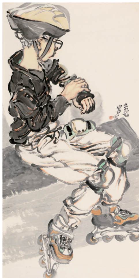
待发(国画) 136×68厘米 李亚光