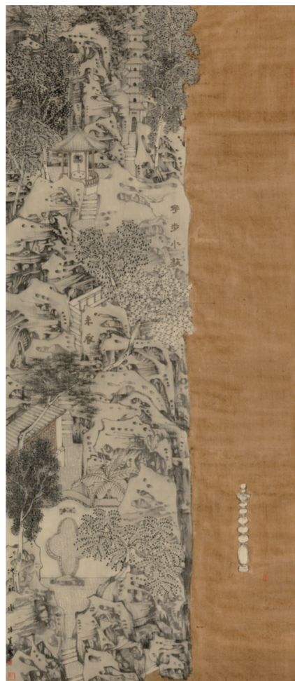
一池秋水(国画) 140×80厘米 孙宽