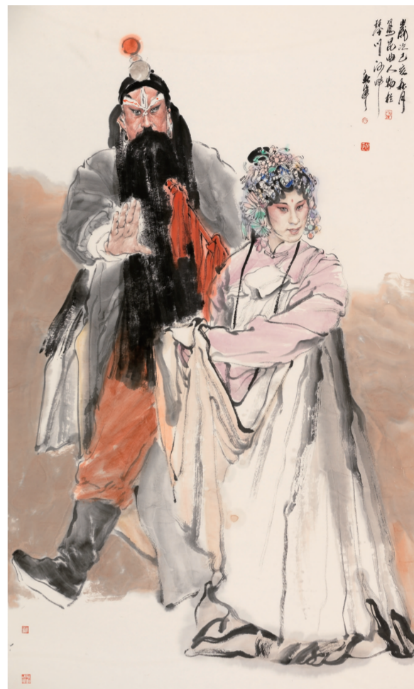
戏曲人物之一(国画) 160×95厘米 姚新峰