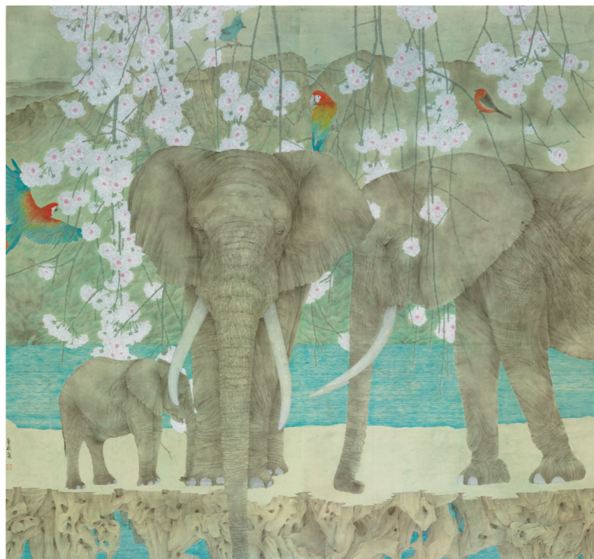
美丽家园(国画) 154×173厘米 华彬