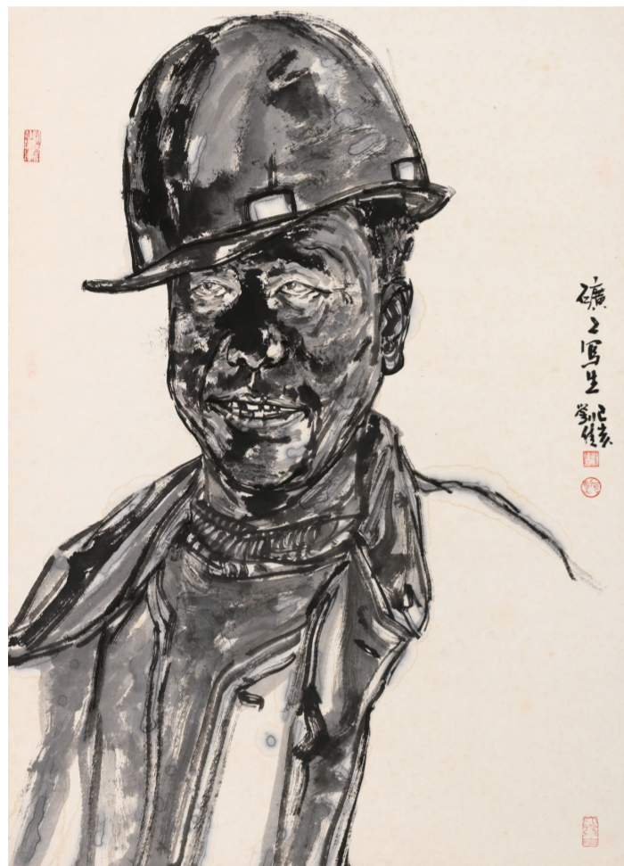
人物写生之一(国画) 110×88厘米 刘佳