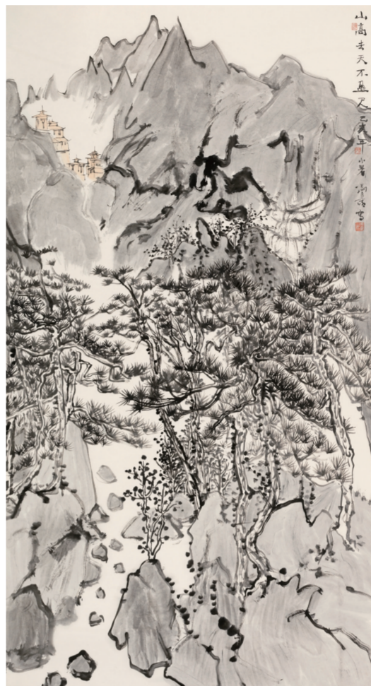
山高去天不盈尺(国画) 180×97厘米 冯蒙