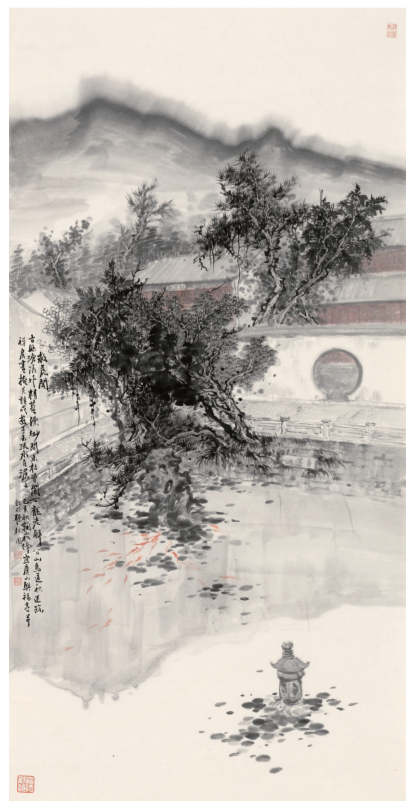
兴福寺救虎图(国画) 136×68厘米 鞠松楠