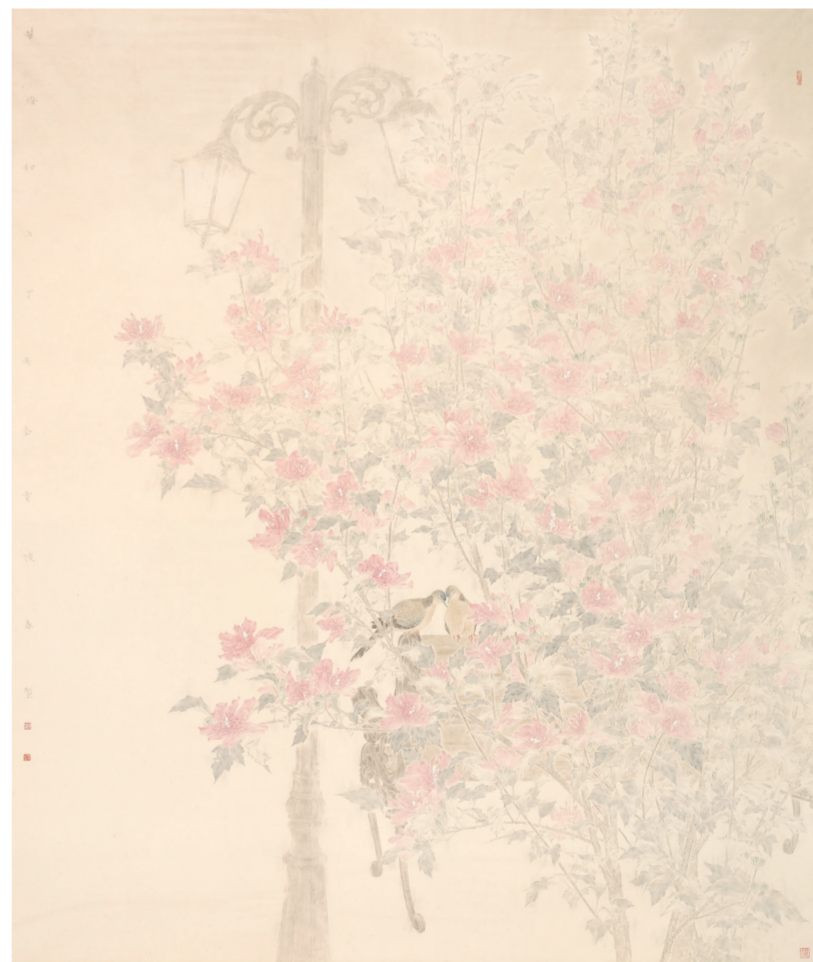
华灯初上(国画) 200×166厘米 贾俊春