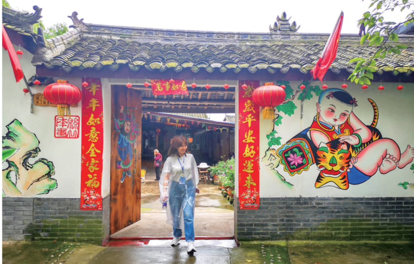
一个被年画画满诗情画意的美丽村庄

往深层次看,艺术是人的精神需要。当生理、安全、社交、尊重等基本需要满足以后,人们就会产生自我实现的