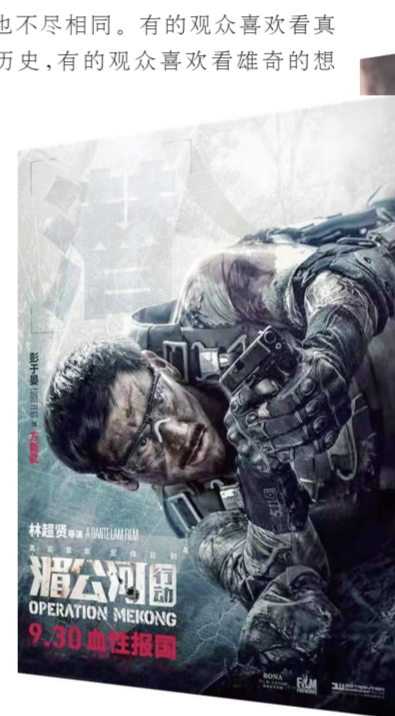
《湄公河行动》电影海报