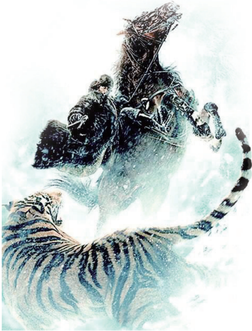
《智取威虎山》电影海报