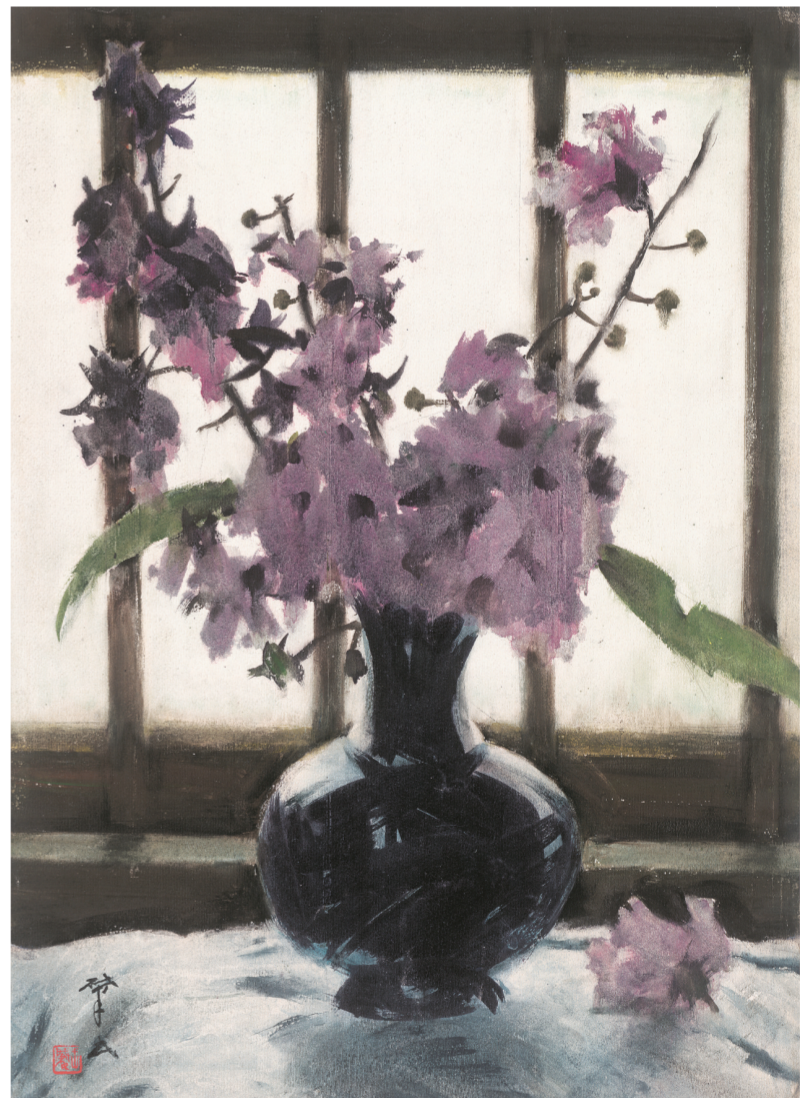
大叶紫薇(水彩) 54×39厘米 1977年 王学民