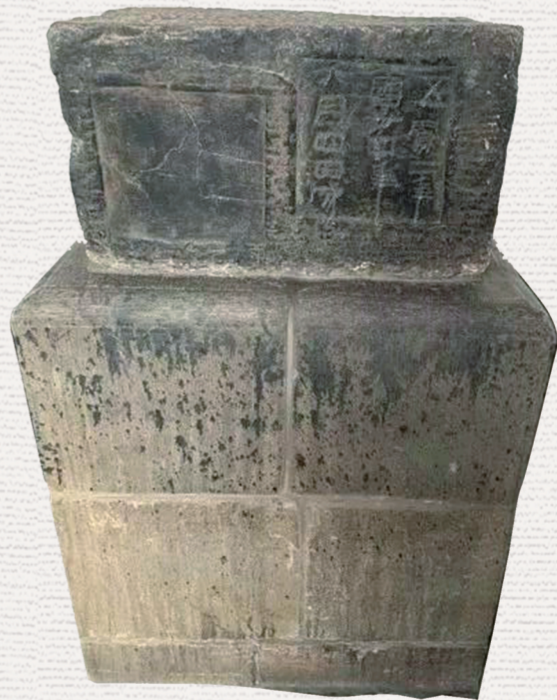
西汉《五凤二年刻石》