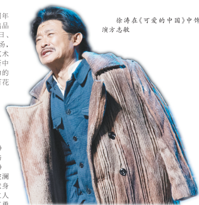
徐涛在《可爱的中国》中饰演方志敏