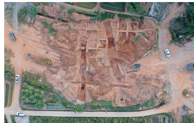
大余滩头窑遗址鸟瞰

窑址中出土的大量酒器与茶具,器型硕大,不适合家庭使用,有专家推断属于公用或商用瓷器,主要销往附近的酒店与茶馆,这反映了五代至北宋时期,地处古代中国南北交通大动脉上的大余县,南来北往的人很多,商业繁荣,是中原通往“海上丝绸之路”的一个重要交通节点。专家认为,大余滩头古窑址的考古发掘,不论是对研究唐宋南岭山区的瓷器烧造技术水平的研究,还是对弘扬大余县古代商路文化的研究,都具有非常重要的考古与历史价值。