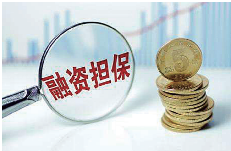
政策性融资担保，在文化金融中发挥着重要作用。

由于上海中小微企业政策性融资担保基金（以下简称“上海担保基金”）的定位原因，上海担保业的突出瓶颈是除上海担保基金外在规模化的项目上不太具有竞争优势，和银行等机构合作时谈判平等性较弱。借助科创板这个国家级的机遇，上海可以在债券融资、长期、